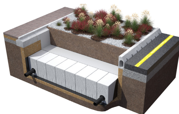
CoreBlue+™ D til anvendelse i bl.a. regnbede