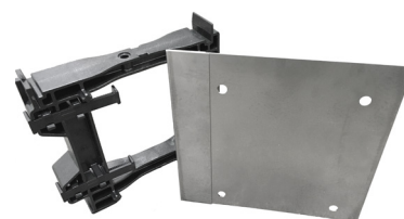
Konsoll og endestykke